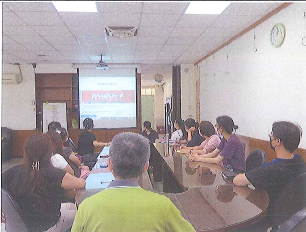
圖 1：定期舉行家庭教育執行工作小組會議，研擬計畫與檢討執行成果